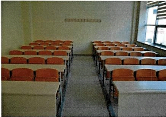
48 Kişilik Sınıflarımız