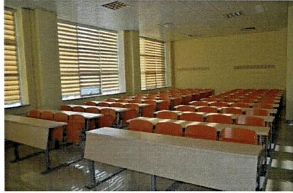
80 Kişilik Sınıflarımız