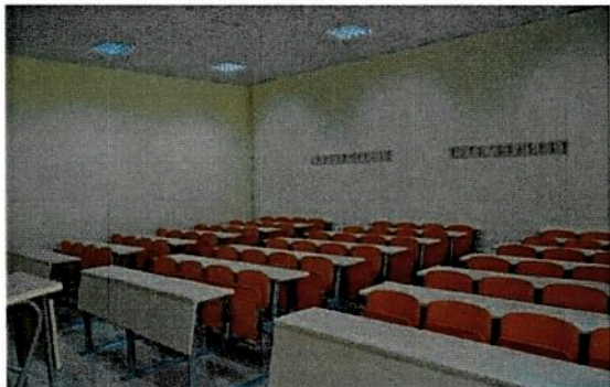
72 Kişilik Sınıflarımız