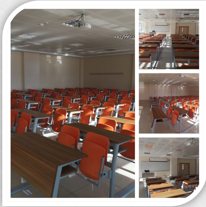
Tablo 1: Eğitim Alanları Derslikler (2019)