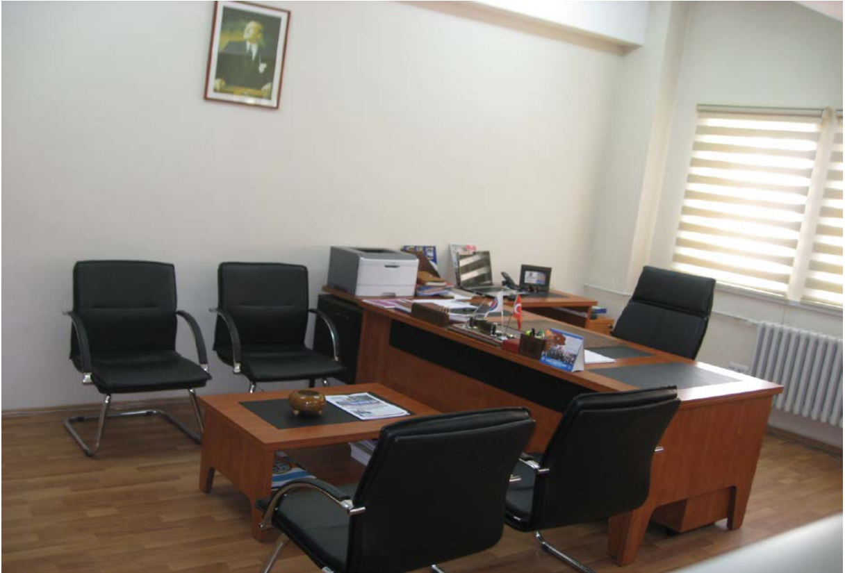
Şekil 1. Makam Odası

Döner sermaye İşletme Müdürlüğü, Üniversitemizin Bağlarbaşı yerleşkesi içerisinde bulunan Rektörlük binası zemin katında yer alan bir büroda hizmet vermektedir.